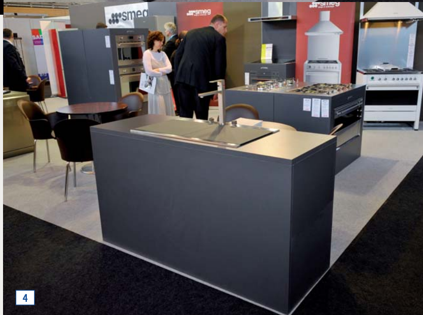
[1] Thierry Voiment, responsable marketing de Smeg France. [2] Le four SCP115A offre un volume utile supérieur de 35 % pour une consommation énergétique inférieure de 25 %. [3 et 4] Le stand Smeg au Sadecc.

Le Trophée du développement durable, catégorie électroménager, a été décerné à Smeg pour le four SCP115A. Avec une enceinte d'un volume plus spacieux (35 % de plus) pour des dimensions extérieures identiques à celles d'un modèle de 60 cm, ce four pyrolyse dispose d'une capacité de 68 litres, supérieure à la plupart des modèles existants. Grâce à cette nouvelle enceinte plus vaste, il offre un niveau de cuisson supplémentaire (le cinquième), pour un très grand confort d'utilisation, optimisé par la présence de rails télescopiques. Autre grande nouveauté : ce four Smeg est aussi novateur au niveau de sa consommation énergétique, avec une économie d'électricité de